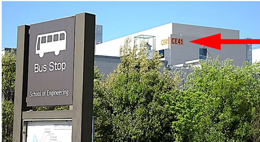
「九大工学部前」バス停からの写真

伊都キャンパス内 最寄りのバス停は「九大工学部前」です。 大学内の各建物には番号が割り当ててあり、 先導物質化学研究所は「 CE41 」、当研究室はこちらの 5階 です。