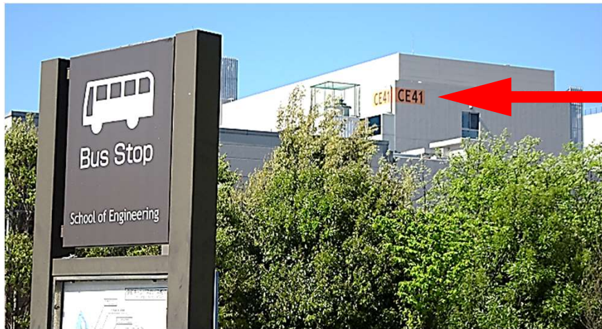
「九大工学部前」バス停からの写真